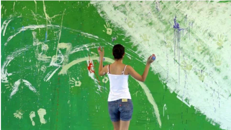
料金表（上映を含む2時間の規定料金）

東京藝術大学大学院美術専攻科修了。1990年代にノイズを含む音声や視覚情報を収集し、ギャラリー空間に再構成したサウンド・インスタレーションを発表する。90年代末からは人と社会の関係性にテーマを求め、主に欧州・豪州・東南アジアにおける多文化状況の調査を通して、ビデオや音声による作品を制作。近年では、以前からの手法に加えて、インスタレーション、テキスト、パフォーマンスなど、使用メディアや作品形態の幅をさらに広げると共に、国内外の都市や地方に滞在し、地域のコミュニティや伝統を現代の文脈の中で再構築する試みを続けている。映像作品としては「ハヤフサ・ヒゲトを探して」(2004)「Kiku Sadud Ruk」(2005)「不随意の共同体ー現代家族ー」(2011)など、いずれも特定地域におけるテーマを顕在化させるためのワークショップを実施し、ドキュメンタリーとして記録するスタイルをとっている。