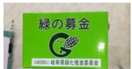
＜募金箱（皐ヶ丘自治会室）＞