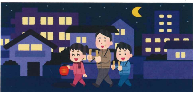
高齢者の火事に関する政府広報とママ賃貸コラムより引用